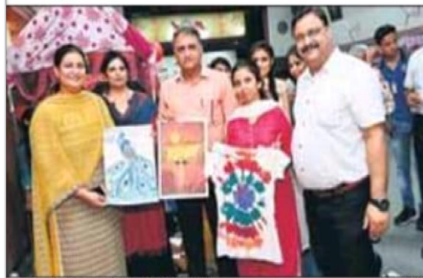
छात्राओं को पेंटिंग को दिखाने मुल अवसर व प्रोत्साहन।